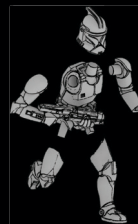
PHASE-I- KLONTRUPPLER SWL_0190