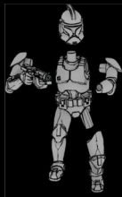
PHASE-I- KLONTRUPPLER SWL_0189