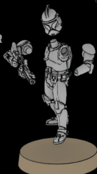
DC-15-PHASE-I- TRUPPLER SWL_0192