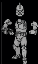
PHASE-I- KLONTRUPPLER SWL_0188