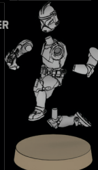
PHASE-I- KLONTRUPPLER SWL_0191